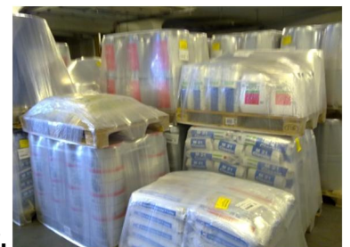
Säcke, Fäßer, Behälter usw.